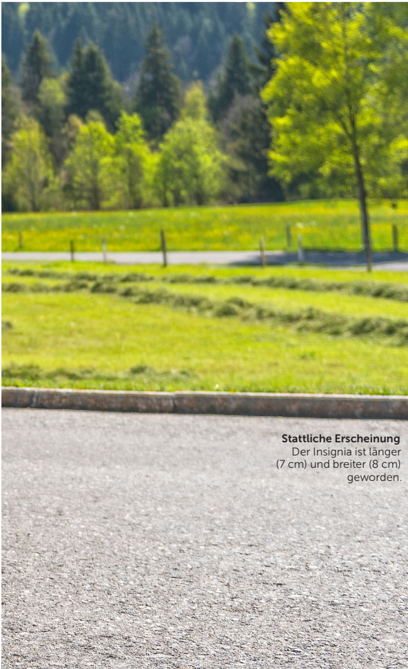
Stattliche Erscheinung Der Insignia ist länger (7 cm) und breiter (8 cm) geworden.