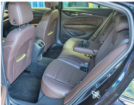
Der Innenraum ist nur ausreichend geräumig.