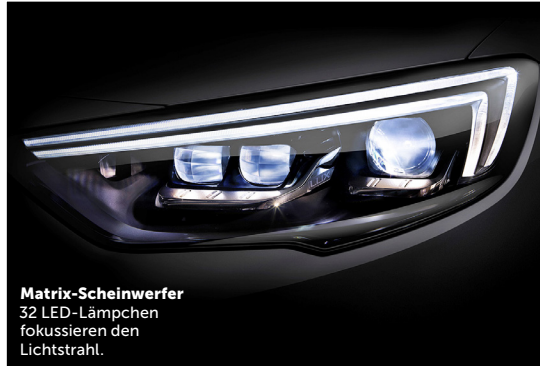
Matrix-Scheinwerfer 32 LED-Lämpchen fokussieren den Lichtstrahl.