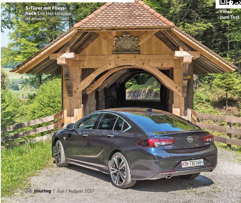
5-Türer mit Fließheck: Die Heckklappe ist enorm.