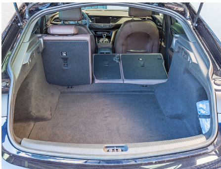
Das Kofferraumvolumen ist angemessen.