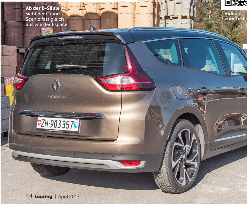
Ab der B-Säule sieht der Grand Scenic fast gleich aus wie der Espace.