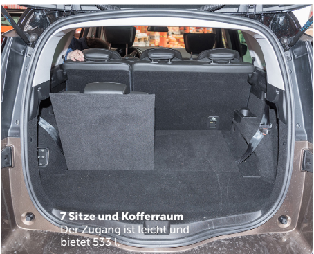
7 Sitze und Kofferraum Der Zugang ist leicht und bietet 533 l