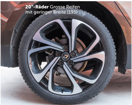
20"-Räder Grosse Reifen mit geringer Breite (195)