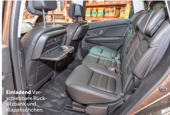
Einladend Verschiebbare Rück-sitzbank und Klapptischen.