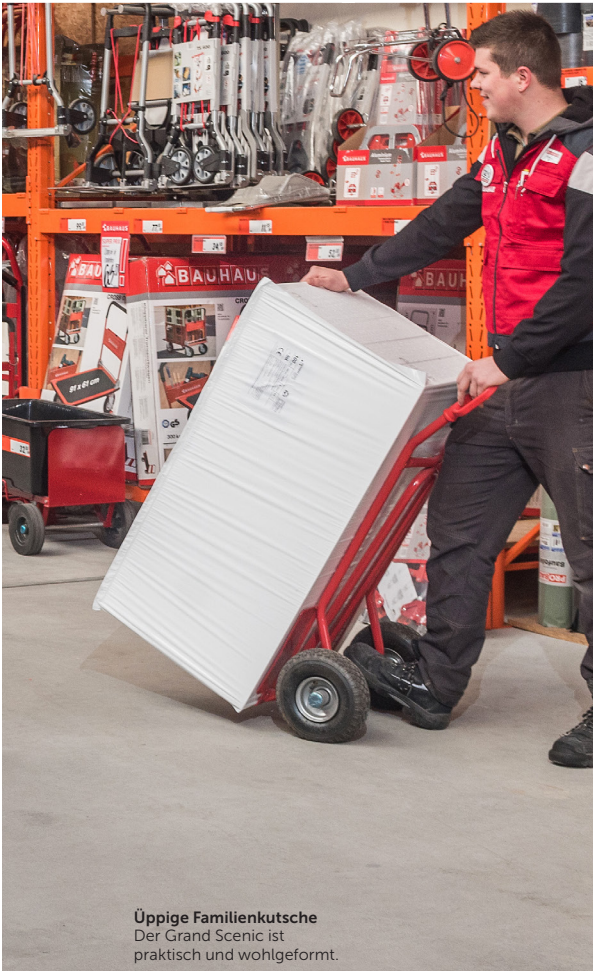
Üppige Familienkutsche Der Grand Scenic ist praktisch und wohlgeformt.